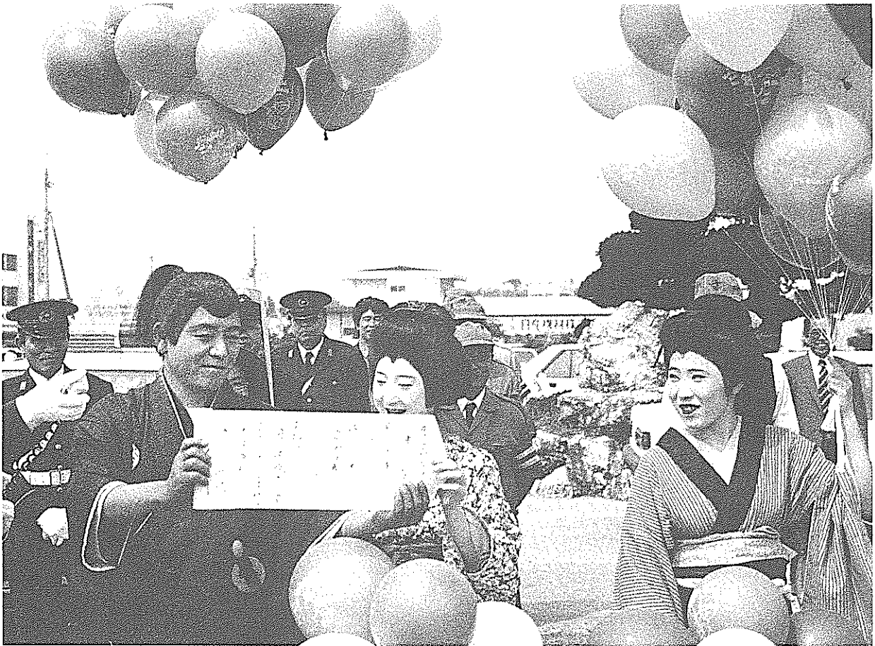
安全運転でたのむぜよ(交通安全パレード)