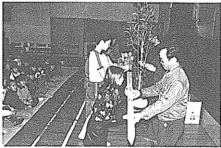
子供たちに記念品を贈る

二月二十八日、南国市子ども会連合会副協会長長の役員、父母ら約四十人による親善キャラバン隊が市内の小学校を訪問、人形劇を上演し記念品を贈りました。