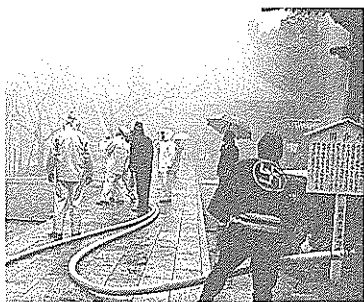
「金堂前で火災が発生」