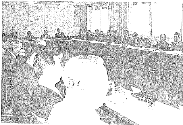
改選後初の農業委員会総会（市役所委員会室で）