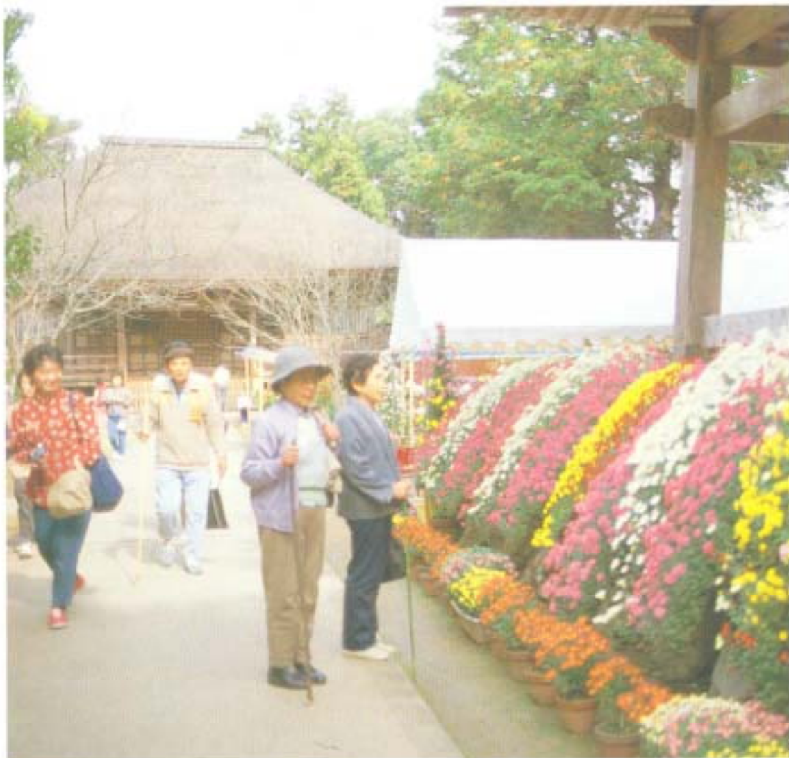
田分寺に菊花薫る