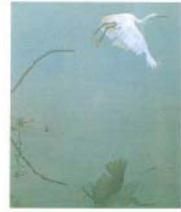
写真『幽幻』村田ゆづり