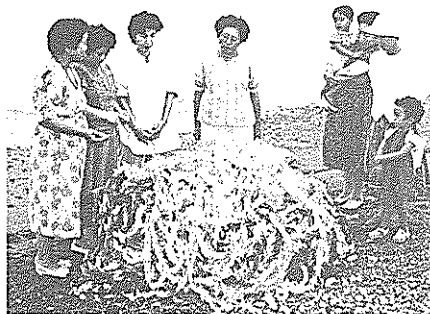
一人一人が平和を誓い合った