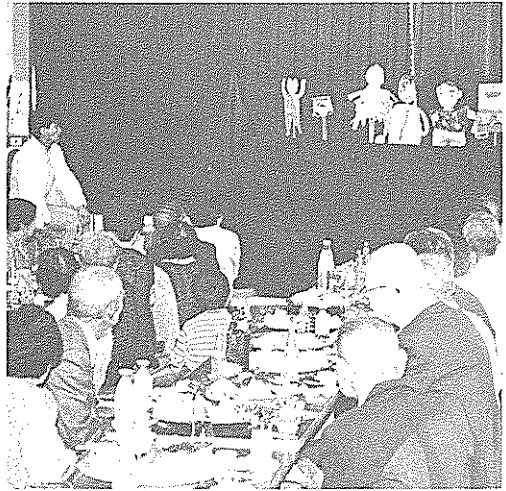
子供たちの人形劇にじっくり（奈川公民館）

九月十五日、「敬老の日」にちなんで、市内各地区で「敬老会」が開かれました。会の初めには来賓の皆さんが今までの苦勞をねぎらうとともに、「これからもいつまでもお元気で」と祝辞を述べ、お年寄りに記念品や長寿手帳が贈られました。その後、どの会場でも婦人会や青年団の皆さん、子供たちが参加して、趣向を凝らした多彩な催しが行われ、集まった人たちは楽しい一日を過ごしていました。