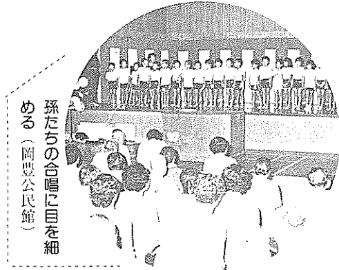
孫たちの合唱に目を細める（岡豊公民館）