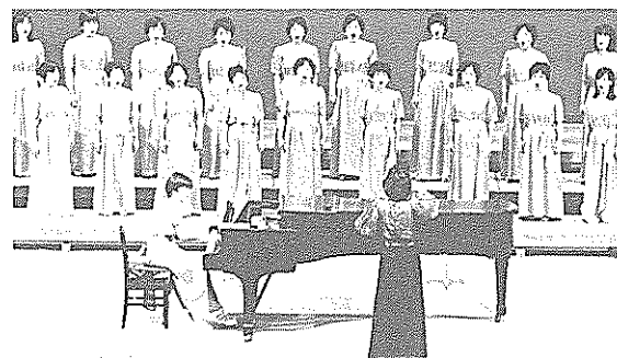
美しい歌声を披露するコーラス大篠の皆さん

TAの団体で、この大会の出場に当たっては、大篠地区をあげて応援。メンバーは「これからもコーラスを大切にして、子供たちと一緒に歌い続けていきたい」と話しています。