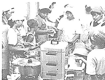
親子が協力して楽しくクッキング

食生活を見直そう——と、健康づくり推進事業の一環として「母と子のクッキング教室」が十市、久礼田、白木谷の各地区で開催されました。