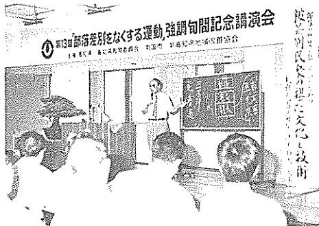
関係者ら約三百五十人が参加

展示即売製品には、すのこやいす、げた箱などの木製品、さんご化と技術」と題して、身分差別の起源や被差別民衆と日本を代表する文化とのかわりについて講演。会場を埋めた人々は熱心に聞き入っていました。