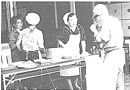
標準の濃さのみそ汁を試食