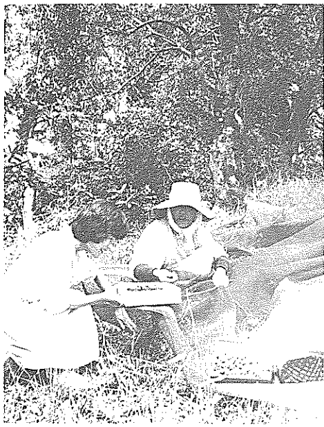
7月上旬まで楽しめるヤマモモ狩り

山に入れば、そこら中に赤い実 が落ちており、甘酸っぱい香りが 漂っています。さっそく一番よく