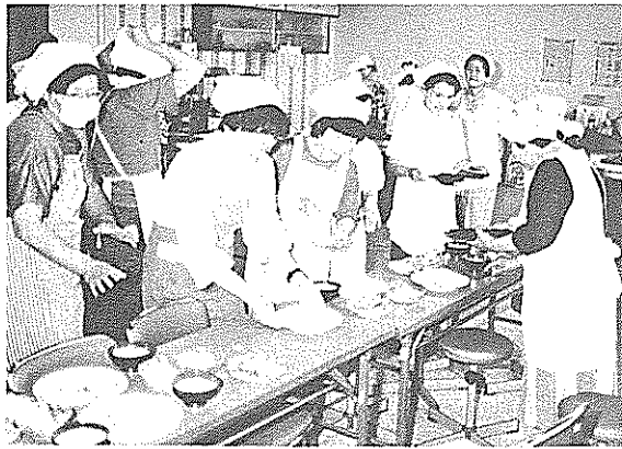
牛乳料理に取り組む婦人部の皆さん