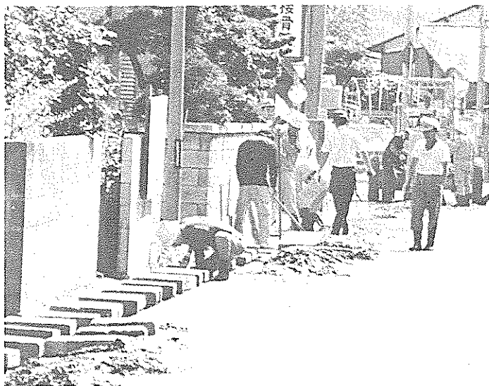
みんなで一致協力して溝さらえ（桶生）

山の不燃物埋め立て地に運ばれたごみは約百四十トン。ほとんどが空き缶や空き瓶でしたが、中には家庭の粗大ごみやハウスのごみを持ち出した人も。 ポイ捨てや不法投棄の多さは市民の美化意識が低いことの表れです。また、海岸地域のごみ問題も深刻です。ふだんから市民一人一人が環境美化に努め、美しい自然を守っていきましょう。