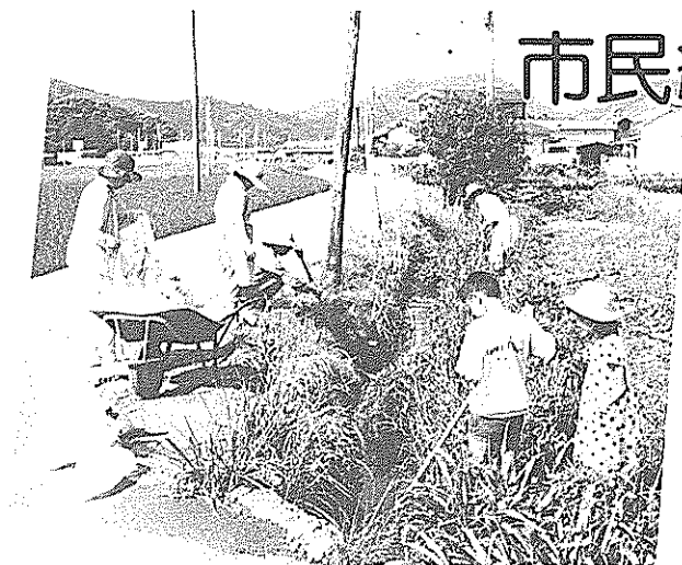
子供たちもいっしょに用水路をきれいに（大埔）