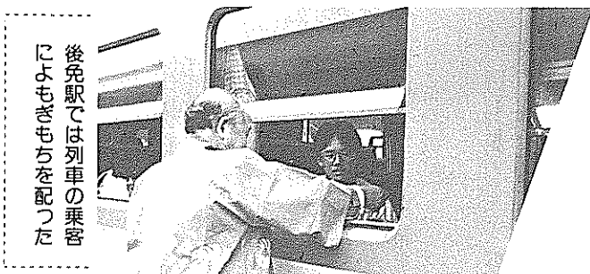
後免駅では列車の乗客 によもぎもちを配った

売し、人気を集めていました。 午後には、国鉄後免駅で駅長に さつきの苗百本を贈った後、一時 八分発の急行の乗客に「ごめん」 の焼き印の入ったつきたてのよも ぎもち約二百個をプレゼント。乗 客は突然のことに少し戸惑いなが らも、うれしそうに受け取ってい ました。 その後、よさこい鳴子踊りなど も行われ、会場は一日中にぎわっ ていました。