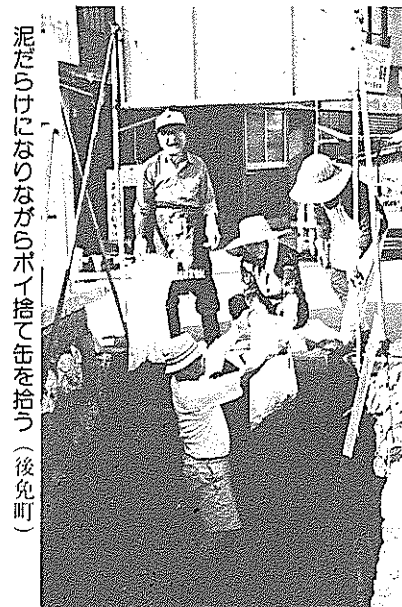
泥だらけになりながらポイ捨て缶を拾う（後免町）