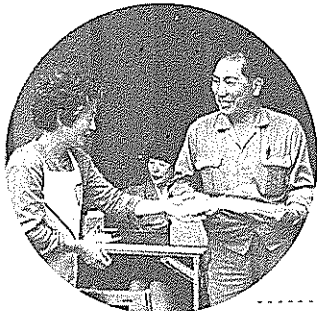
献血者全員に卵をプレゼント