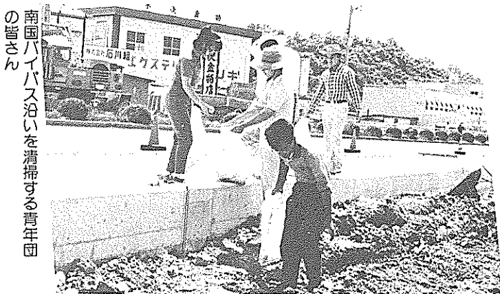
南国ハイバス沿いを清掃する青年団の皆さん

環境週間の六月八日、恒例の市内一斉清掃が行われ、各地区で早朝から市民の皆さんが清掃に汗を流しました。 この日は、各地区会、老人クラブ、婦人会、青年団などが積極的に参加。日ごろ清掃する機会の少ない河川や排水路、道路などを泥まみれになりながら清掃しました。市内百五十カ所を集められたごみは、市の各課長が十五台のトラックに分乗して回収。この日、片