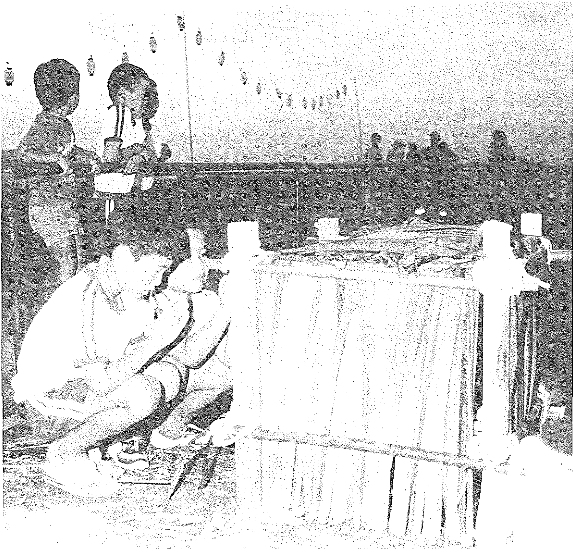
子供たちのエンコウ祭り（前浜）