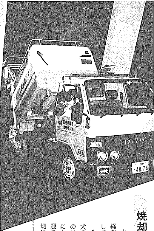
香南七カ市町村からの ごみは、一日六十七トン

金属類の混入も多く、ときには犬の死がいも。特に鎖など長いものは機械にまきつき、故障の原因にもなっている。皆さんの負担で運営している施設です。もっと大切に利用してほしい。