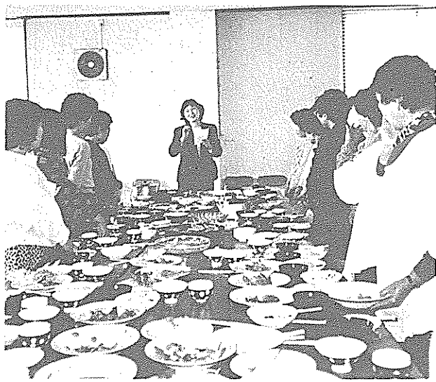
懇親会には、勉強の成果を生かし、自分たちが考え出した成人病予防の料理も並んだ

今年度の修了者は二十八人。この食生活改善推進教室は、各地域で正しい食生活の指導を進め、市民の健康づくりをと、五十九年六