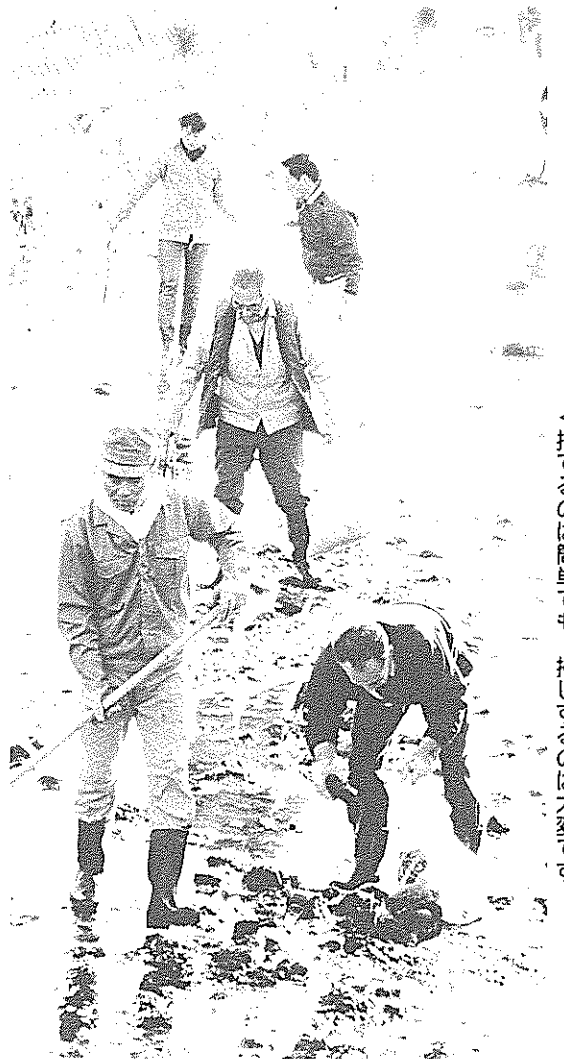
▲捨てるのは簡単でも、掃くのは大変です

川干が始まった三月二日、不法投棄が絶えない舟入川で、流域住民百人が一斉清掃を行いました。場所は、後免西町から高知市境の小滝までの約三キロ。 午前八時から、長靴、軍手姿で、ごみ袋片手に缶やビン類、発泡スチロールなどを拾い集めました。中には、ホームトイレや鳥の死がいも。昨年よりごみは増え、用意したごみ袋は足らなくなる始末。特に篠原一本松近くの堰では「去年の五倍は多い」とあきれられるばかり。 何度清掃しても、これでは「私たちごと」です。環境美化に対する自覚を、市民一人一人が真剣に考えてみましょう。