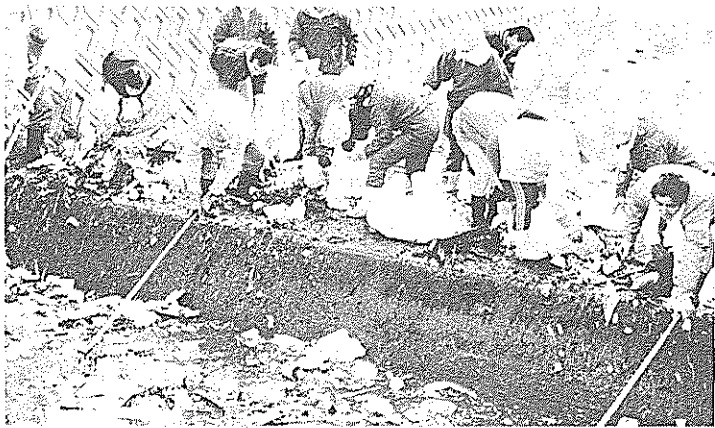
一本松の堰では、昨年の五倍のごみ