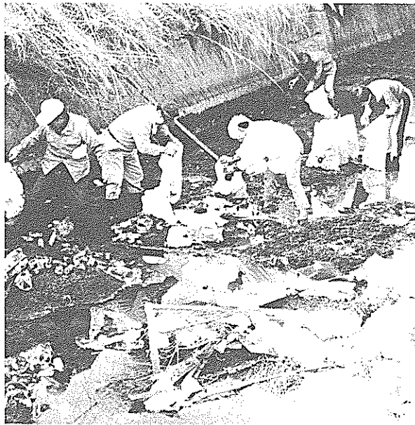
▲捨てられたごみは木切れ、果てはホームトイレまで