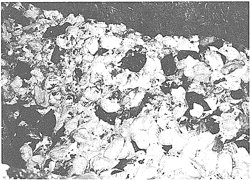
ごみ袋の中には金属類の混入も多い。正しく分別を!