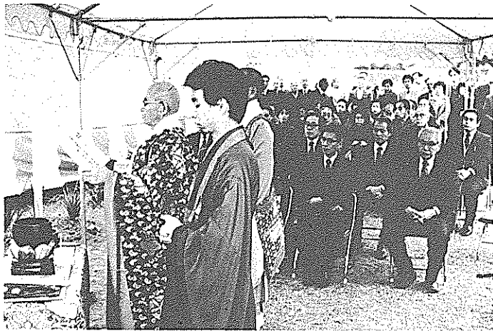
平安の歌人紀貫之をしのび、約100人が集まり開かれた 「土佐日記門出のまつり」