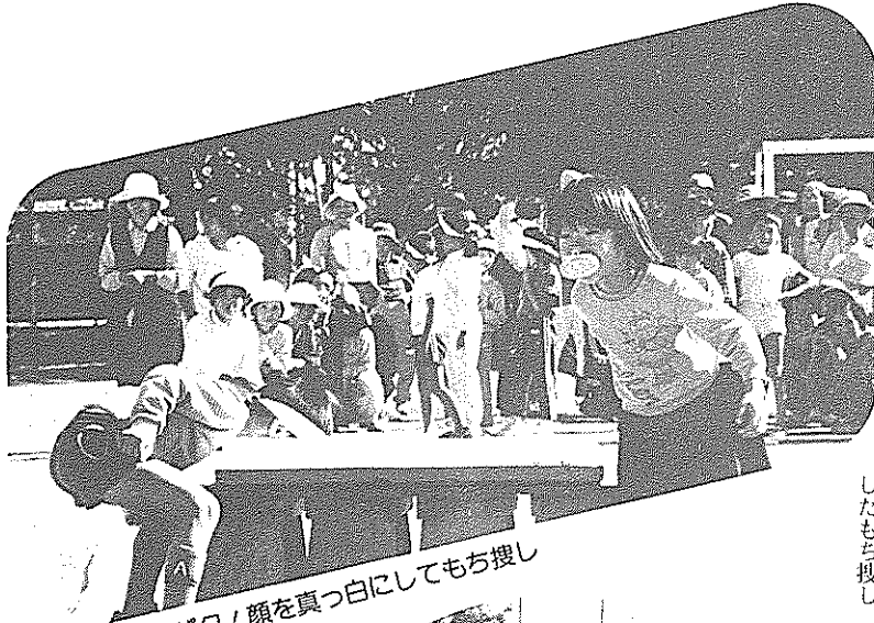
パウ / 顔を真っ白にしてもち捜し

いうさぎとかめになつてのリレーや借物競争、力の込めつた綱引きなど、競技は十二種目。服装の応援も加わり、また三・三・七拍子の拍子をとる子供たちも。この日は、子供たちと遊ぶことの少ないお母さんも童心にかえて競技に汗を流し、子供たちもお母さんにちよつぱり甘えながら楽しんでいました。