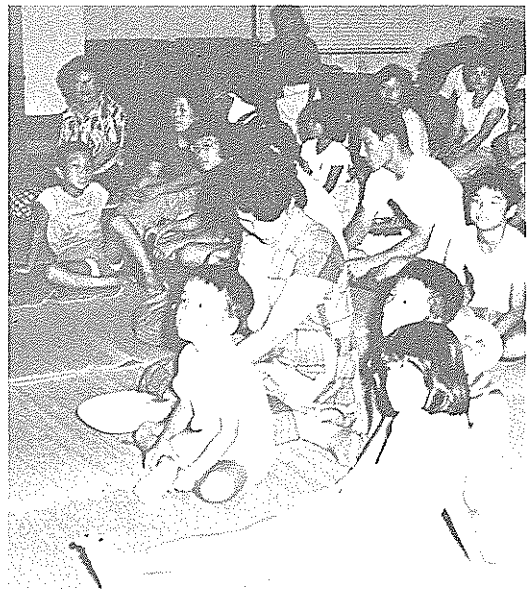
懐かしい映画を楽しむ観客