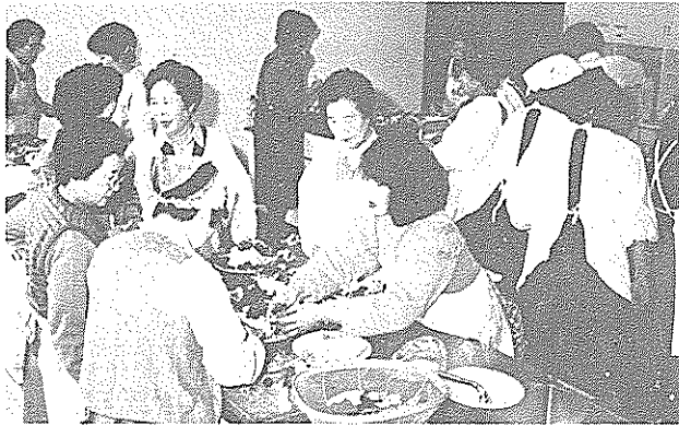
昨年の食生活改善推進教室での実習風景

「人集めの難しさをととても感じました。だれに連絡をとっていいかわからず、推進員が各地区に一人はいるようになったらいいですが」、「料理実習のほか、健康体操や健康についての講演会など広い範囲の健康づくり活動を進めている」、「農協婦人部、婦人会などと積極的に協力していくことも必要だ」、「推進員の存在を知らない人も多いので、広く地区の人にP