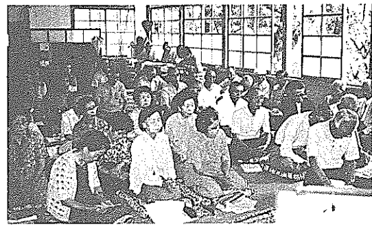
楽しく学ぶ学級生(昨年の高齢者教室から)