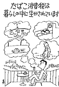
たばこ消費税は暮らしの中に生かされています