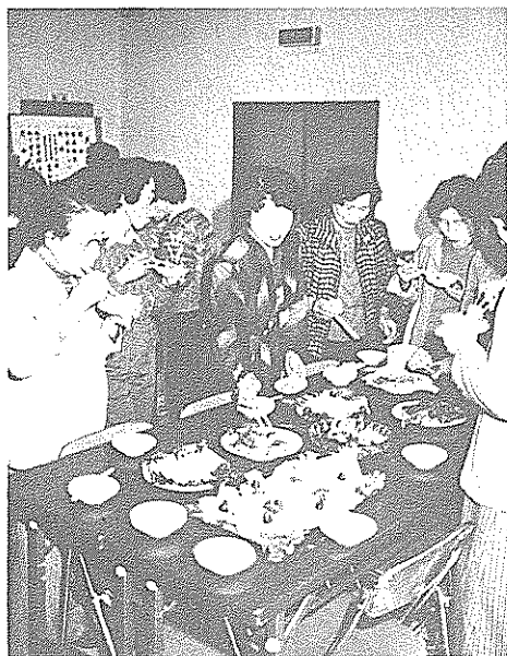
教室で学んだ料理を囲み、話もはずんだ懇親会