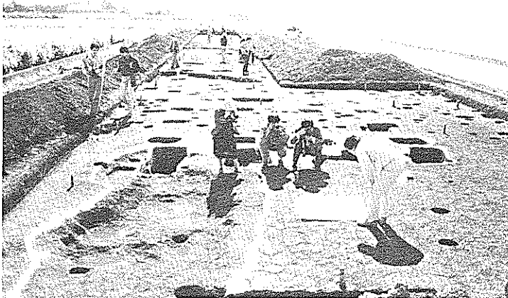
官衙に付随する建物跡が発見された内日吉の現地

調査は十月一日から始まり、比内内日吉二ノ坪の四百二十四平方メートルを発掘。 出土遺物は約一万点、漆器（甕かめ）などの土師質（はじしつ）土器や須恵器、青磁など。遺構は、一棟の堅穴住居跡、五棟の掘立柱建物跡など。