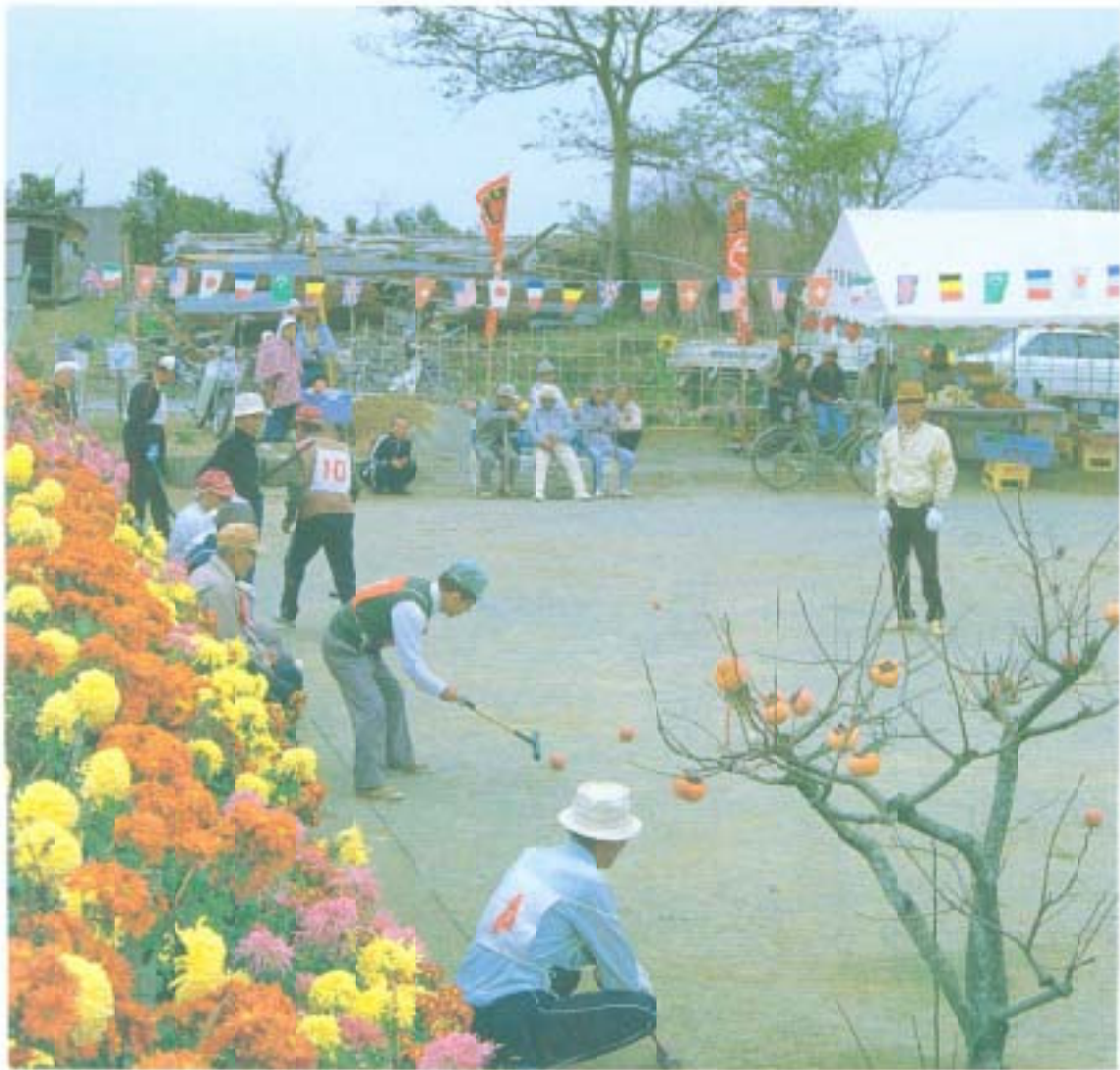
菊の香り漂う中で、ゲートボール(十市北坪通で)