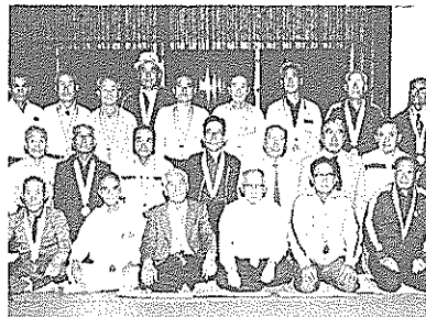
優勝したゲートボールチームの皆さん