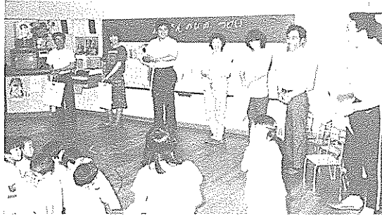
▶自作の似顔絵プレゼント ▲子どもたちの楽しい劇にみんな大喜び

「父の日のつどい」の始まり。子どもたちは、練習を重ねた歌や踊り、劇を披露。我が子のかわいいしぐさに、お父さんは目を細めていました。また、お父さんやお母さんが参加するイス取りゲームになると、子どもたちから盛んな声援が送られ、童心に帰って楽しんでいました。