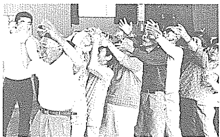
楽しく汗を流す学級生

■応募方法：ハガキに「中央高齢者教室申し込み」と書き、氏名、住所、生年月日、性別、電話番号を記入して、南国市教育委員会社会教育課(南国市大田甲二三〇二)まで。