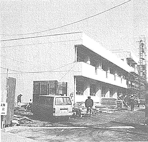
完成間近の大篠小特別教室

昨年十月から行われている大篠小、香長中の校舎の増改築工事が順調に進み、三月末の完成を目指して、仕上げの工事が急ピツチで行われています。両校共にジェット機の騒音対策事業によるもの。