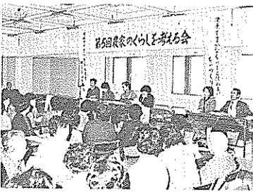
盛況だった農家の暮らしを考える会