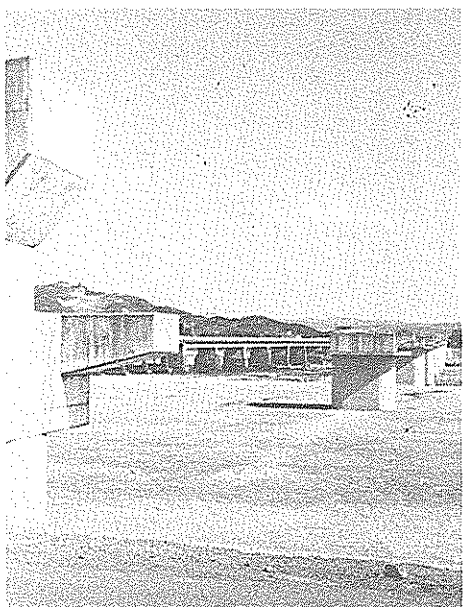
物部川に建つ阿佐線の橋脚

阿佐線沿線の関係市町村は十五市町村。うち十三市町村については、すでに第三セクター加入の同意を示しており、残るは本市と一自治体が態度保留となっています。この日は県東部開発促進会の安