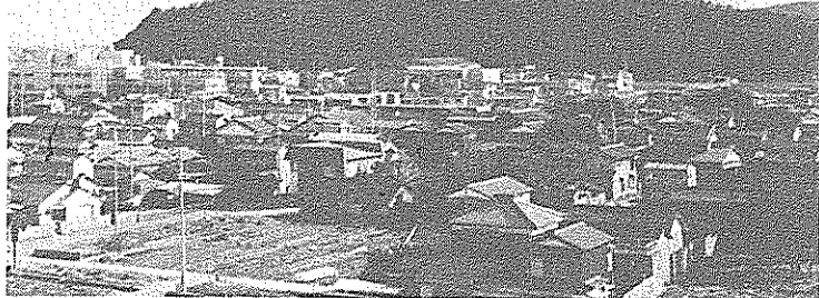
再カットが行われ、公園化が予定されている吾岡山

れ、周辺住民には昔から親しまれてきた山でもあります。その跡地の公園化問題について協議している「大篠地区周辺環境