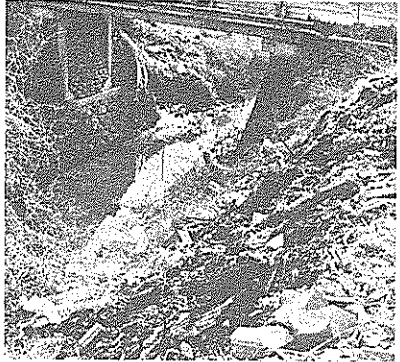
ゴミの不法投棄で汚れた東沢放水路

◎水止め水路一山田堰井筋水系全部 ※ただし、天候、浚渫(しゅんせつ)作業の都合により延長することもあります。