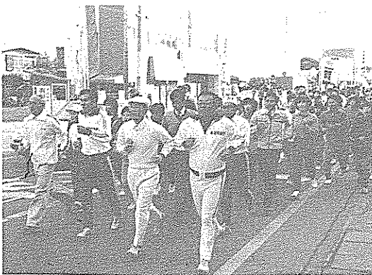
市長を先頭に150人が元気に走り初め

新春の一日、瓶岩マラソン大会が開かれ、遠く中村市や安芸市など県下各地から百四十五人が参加し、元旦のすがすがしい空気の中で、小学生から大人までさわやかに汗を流しました。