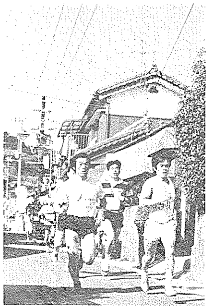
初日の中を力走する選手