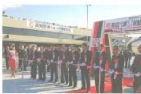
祝賀を記念してテープカット