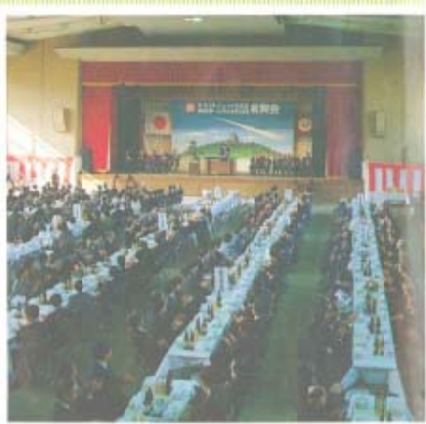
記念祝賀会には地権者など約700人が集まった