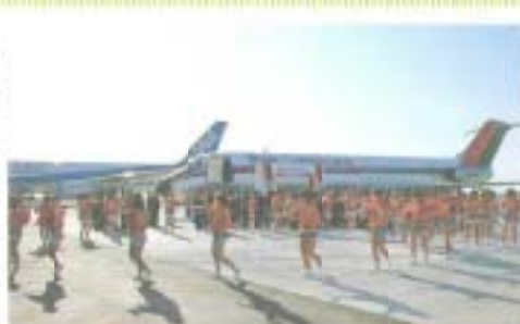
獅子踊りで祝賀を祝つ