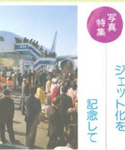
東京からのジェット機第一便が到着

と懸念されております。これからは、これらの条件を活用し地域産業の振興や臨空型農業、生果企業など、公営のない中小企業の誘致に努力します。そして一次、二次、三次産業の調和のとれた豊かな街づくりを努めたいと考えます。