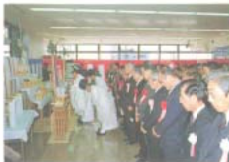
関係者が出席して行われた 空港ビル竣工式典