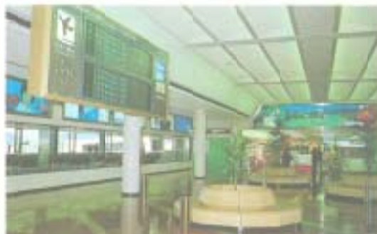
ターミナルビル2階待合室