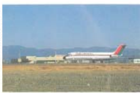
新幹線で飛び立つJRCB