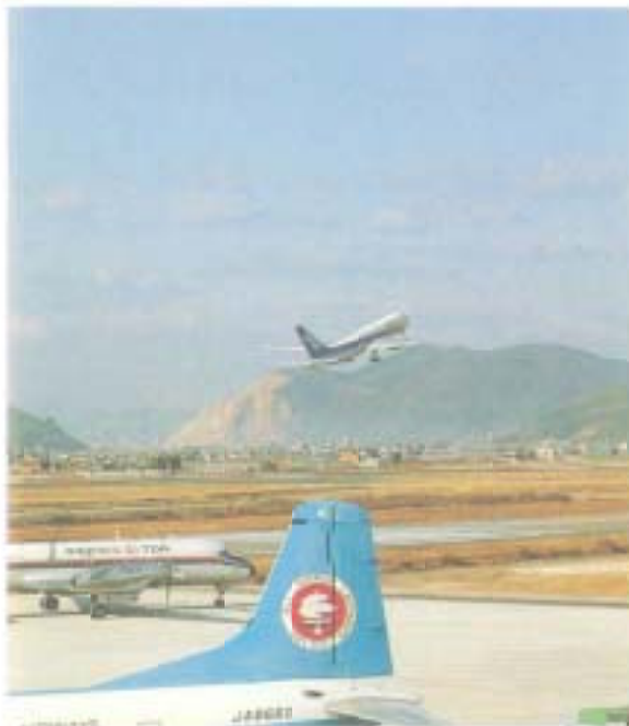
高知の空に初めて飛んだ8767