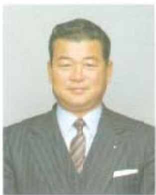
南国市議会議長 岡崎 俊一

このような中で、南国市は多くの重要課題を抱えております。中でも、し尿処理場建設と赤字解消の重要ポイントとなる比江山の残地処分問題は一刻の容れも許されない課題であり、年内に解決するよう急務するものであります。