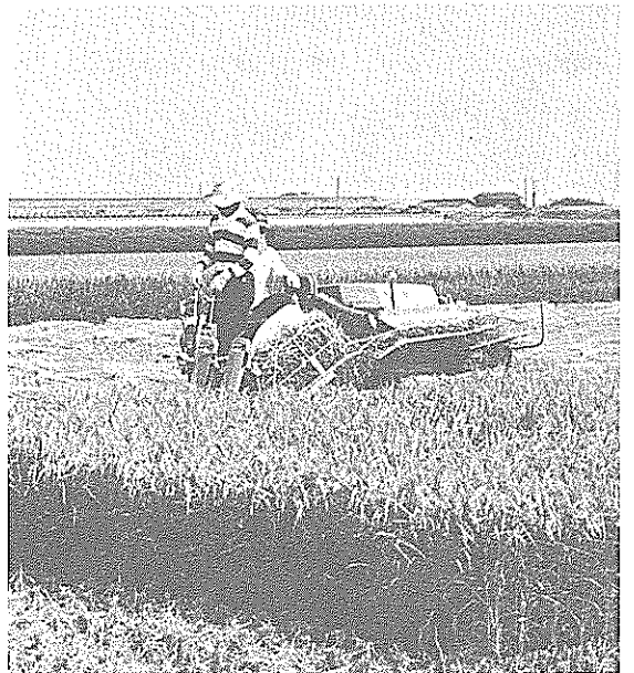
香長平野では、今稲刈りが真盛り(8月10日)

また、この間の国会で農地法の改正が行われました。それは兼業農家、なかでも農外収入のほうに農業収入を上回る第二種兼業農家を農業生産者から切りはなし、男子農業従事者のいる、いわゆる中核的農家に、たとえば請負耕作のよ