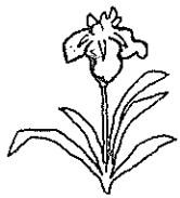
福祉事務所社会係