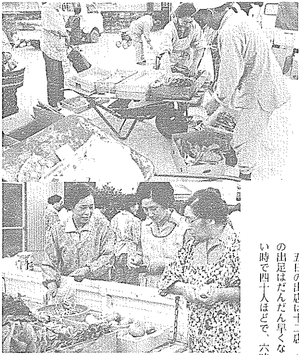
主婦でにぎわう朝市

五日の出店は十二店。お客さんの出足はだんだん早くなって、多い時で四十人ほどで、六時半ごろ