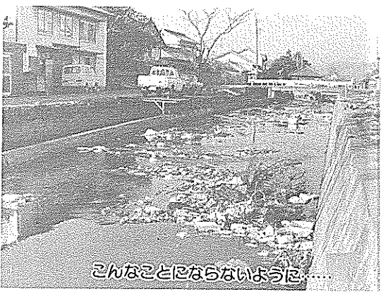
こんなことにならないように……