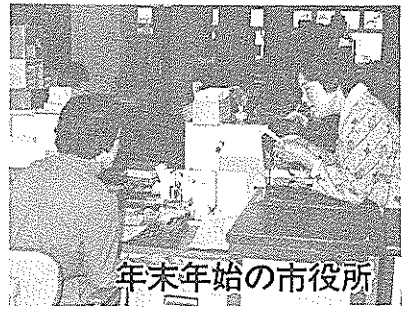
年末年始の市役所

市役所は12月28日(木)がご用納めです。来年は1月4日(木)から仕事をはじめます。