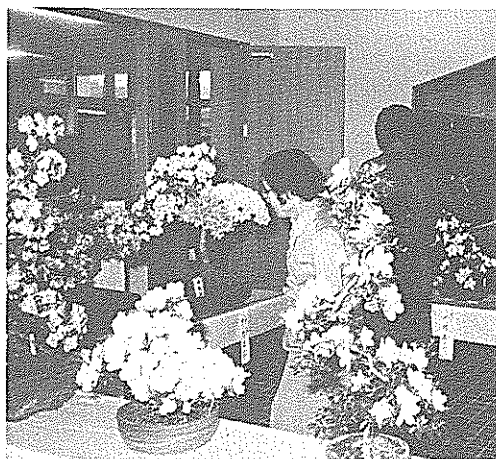
さつき作りの楽しみを披露する第1回さつき盆裁展が、5月27日から3日間、社会福祉センターで開かれ、約50点が展示されました。会場には、白やピンクの花が咲き、1年ものさつきも気楽に展示され、なかなかの好評でした。