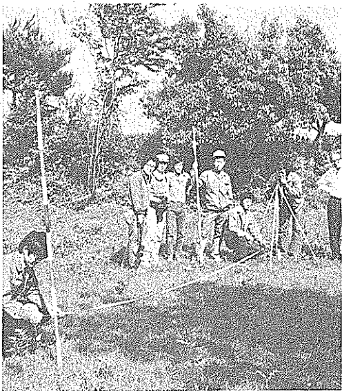
測量調査をする高専地方史研究部のみなさん

的には明らかではありませんが、城に最も近い「中ノ土居」から城に結びつく城道があり、多分「中ノ土居」が城下土居ではなかつたかと推定されます。