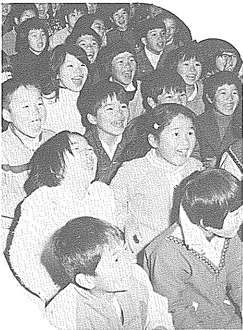
お母さんが安心してあずけられる保育所。児童・生徒がのびのびと学べる施設。市民の要求はつきない。

これを類似団体(市と似よつた都市)と比べてみますと、昭和四十八年度に借入れたものが市民一人当たり七千六百六十二円、一〇・四割に比べて市は一万三千七百七十五円、一四・九割と大変多くな