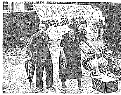
日章地区のおとしよりも ささいあつて参加