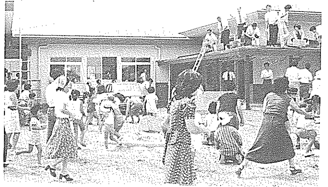
岡豊・里保育所完成