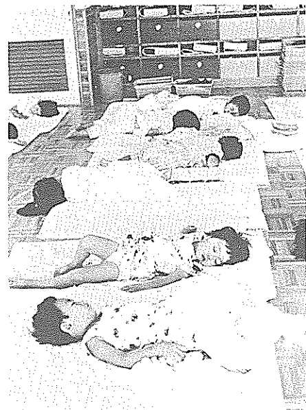
気兼ねのない昼寝天国(里で)