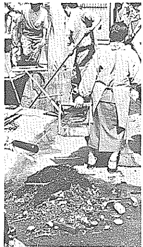
▲ここ後免西町でも消防車を動員して大がかりな清掃に市民は汗を流した。