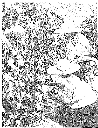
▲家族そろって“メロンとスイカ狩り”。を。西島園芸園地は6月8日から7月8日まで、ハウスを市民に開放。