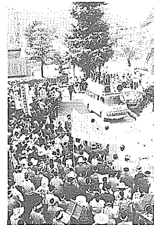
▲高知空港拡張の公聴会を中止させようと反対市民が県庁におしかけたが、話し合いは平行線。(5月27日・県庁前で)