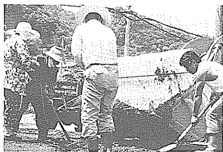
▲みんなの町をきれいに。6月9日は一斉清掃の日。ビニールや不燃物など、ぞくぞく集積場所にもち込まれた。(稲生の溝ささえ)

午前7時～午後7時 ただし、成合・天行寺・桑の川・黒滝・大改野・中の川・中谷・上倉は午後5時までです。