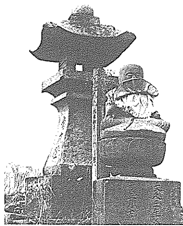
汚れた空気にはマイッタよ