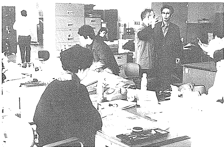
写真右＝市民課の窓口は、ご用始めの最前線。折詰とお酒を横目に、来客でテンテコ舞いだ。