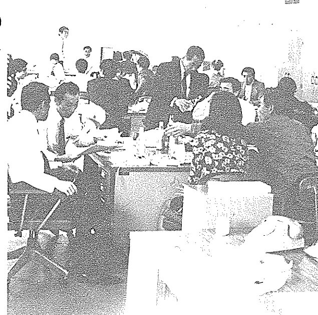
さあ、今日から俺たちの職場だ。事務室では、最初で最後の酒宴を。はって、明日からの元気づけーッ