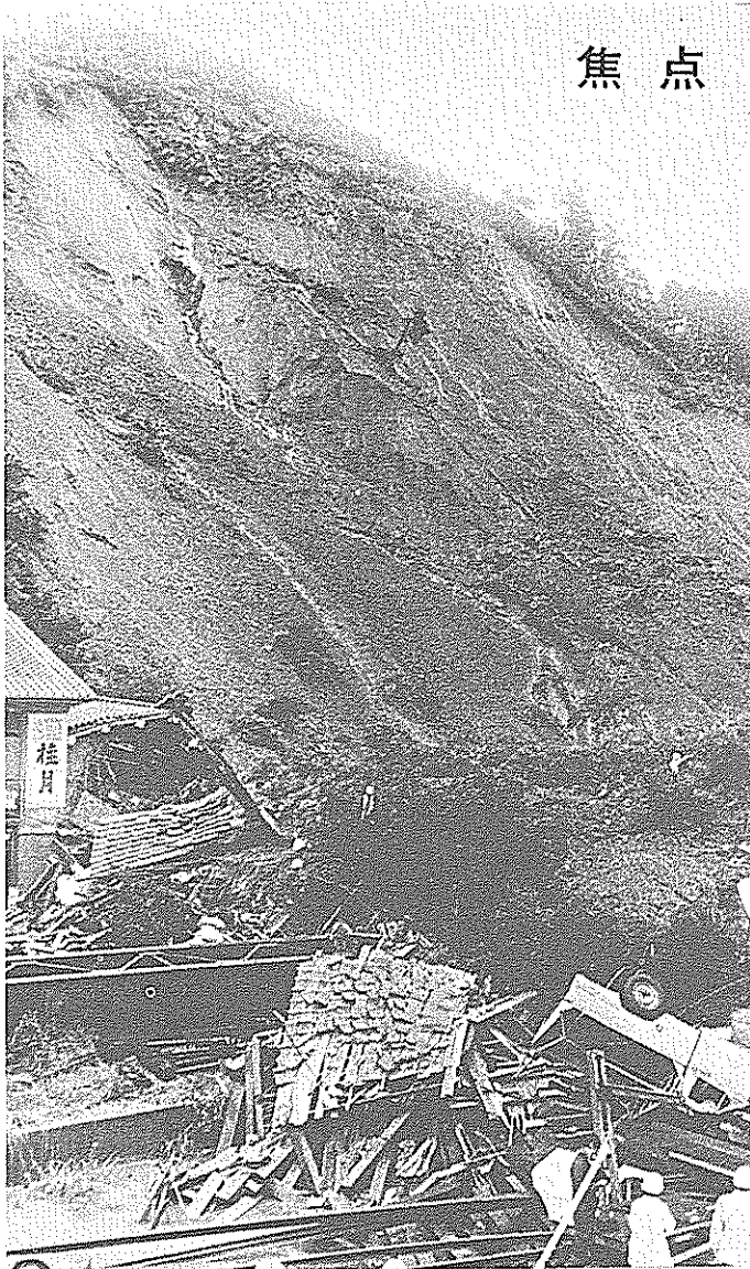
《県知事公室広報係撮影》

七月五日、一日 県などの指定がな 七四一が、最高一 かつたといわれる。 時間に一〇〇が近 しかし、わたした い豪雨に見舞れた ちの周辺をみまわ 土佐山田町繁藤で してみても、無計 行方不明の消防団 画な山地や宅地の 員の捜索作業にあ 開発など危険地域 たっていた消防団 のみでなく、すべ 員ら二百人が、二 てが危険地域であ 度目の大崩壊のた るということ、 め六十人（7月21 あらためて肝に銘 現在）の死者行方 すべきである。 不明者をだすとい この悲惨な大事 う大事故が起きた 故が、二度とおき この地区は、危 ないよう教訓とし 険区域として国 なければならぬ。