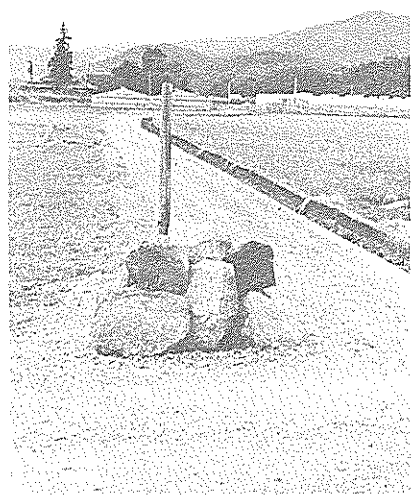
車・おことわり 八幡で