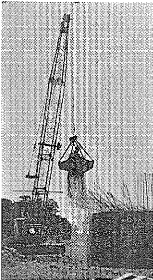
橋脚内の土砂が取り除かれ、じよじよに橋脚が沈められてゆく