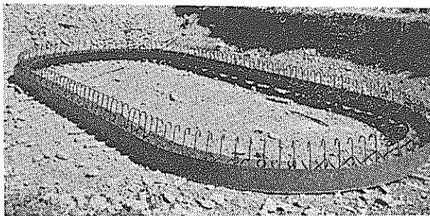
長円の基部の上に鉄筋が組まれコンクリート壁がつくられて、なかの土砂が掘り取られます。

南国バイパスと、赤岡バイパスを結ぶ新物部川橋の橋脚工事は、昨年末から始められていましたが、いくつかの橋脚が姿をみせてきました。