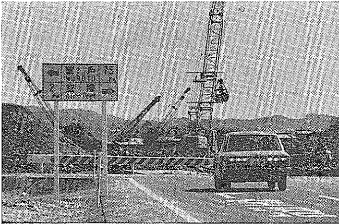
南国バイパスの東端、物部川堤防は切り取られ、橋脚がつくられています。