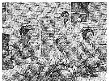
写真は衣笠老人クラブ員

海週日曜日の当日は、衛生委員の指導、指示にしたがって、各部落の人たちの交替による当番制に