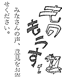
みなさんの声、意見をお寄せください。

時の流といいますが、内外の問題を問わず、個人間の争いまで多くなってきたことは、これも無理と道理との区別がだんだんむつかしくなってきたためではないでしょうか。