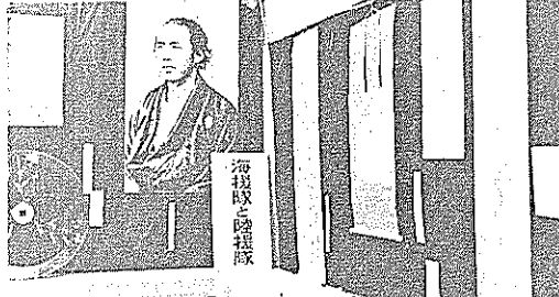
座が中央公民館において開かれています。

★ 立田西町へ移転、新築工事がすすめられていました。日章郵便局は12月15日に落成しました。