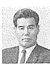
後免町二 業 精肉販売 後免町二 五五番地