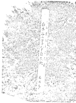
こもりとして樹勢のよい 自生タチバナ

法は…… 郵便物の窓口へはんをこまめにたたくか、お忙しいときは電話や書面でもさしつかえありません。また、お申し出は差出人、受取人のどちらでもかまいません。