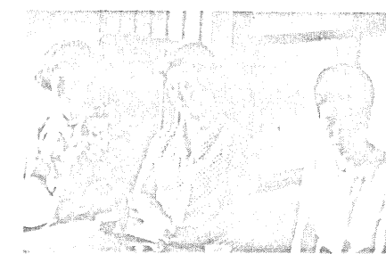
だまされ上手に だまし上手

▼性格の違っていることは、お互 が理解し合ってゆけば幸せは生 れるもので、理解し合う努力が するようだ。