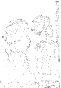
おはなはんはかしくさるが、ほど はどに切り盛りしてゆくところ に其威が湧いてくる

▼主人のいいなりになってる妻 がよいが、多少主人に反発する が、家のために働くといった方 がよいものか、……ところ ▼女性が発達したら、男性は気 持が安らがると思う。ある程 度の仕事をし、言葉を解する女 性でなくては…… ▼たとえば「おはなはん」のよう な女性はどうだろう。女性が見 てよいものだから、男性が見 てよいものか、……「おはな