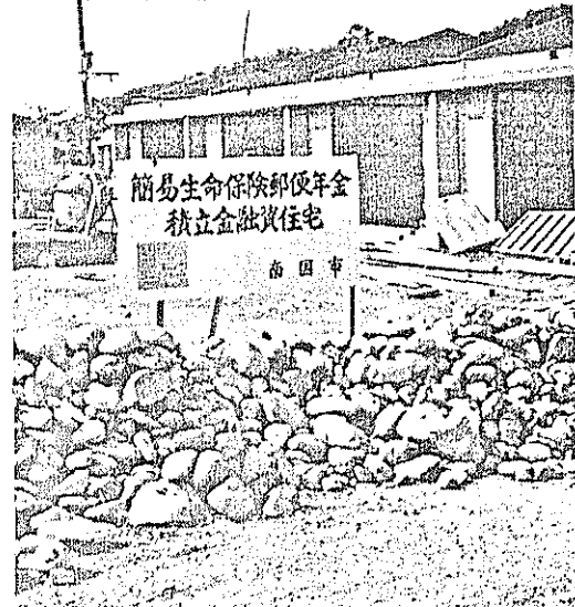
四十年のモデル事業で建築されている市営住宅（二十四戸）、この工費は二千万円で、起債は簡易保険の積立金の融資によるもの。

市が同和地区に對し、社会、経済、教育文化などの改善向上をはかるために、国県の大規模な事業として実施したものであって、一般財源二千三百三十六万一千円のうち、約三分の二の千五百五十七万四千円は義務的に特別交付税として還元されていますので、残りの七百七十八万七千円の一一般財源で、十二、五倍の事業が実現したことになってい