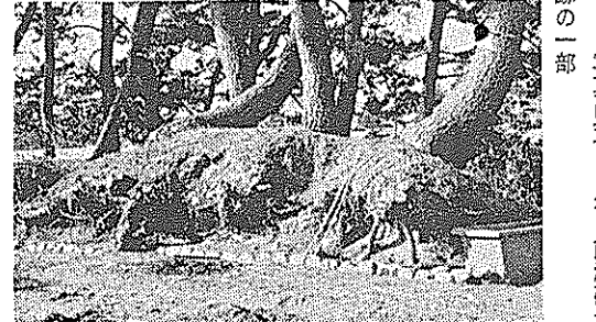
そこなれた史跡や遺物はなく、いちど周りに注意してみよう。写真は荒らされる前浜砲台跡の一部