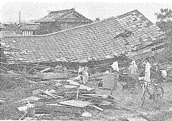
倒壊した住家 一片山一

おびたしく、そのため生活に大きな脅威を受け、その惨状はまさに被害にたえないものがありま るもの 撃をうけ、その他農作物の被害や漁港、船舶などにも甚大な被害を受け、みなさま方のご心痛いかばかりかとご推察申しあげ、心からお